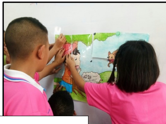
การจัดกิจกรรมด้วยกระบวนการ play and learn

๑.๓ มีแนวทางในการบริหารจัดการชั้นเรียนและจัดบรรยากาศในชั้นเรียนที่เหมาะสมและช่วยส่งเสริมการเรียนรู้ของนักเรียน