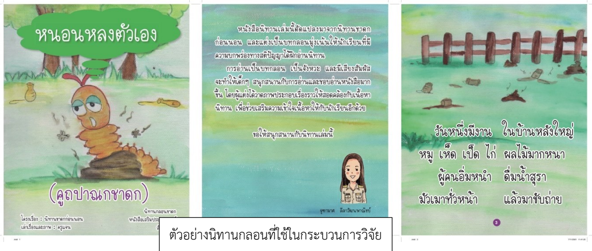
ตัวอย่างนิทานกลอนที่ใช้ในกระบวนการวิจัย

๑.๖ มีสื่อการเรียนรู้ และแหล่งการเรียนรู้สำหรับใช้ประกอบการจัดการเรียนรู้ และให้นักเรียนไว้สืบค้นเพิ่มเติม เช่น เอกสารประกอบการเรียน สื่อที่จับต้องได้ คลิปวิดีโอ และเกมที่สอดคล้องกับบทเรียน